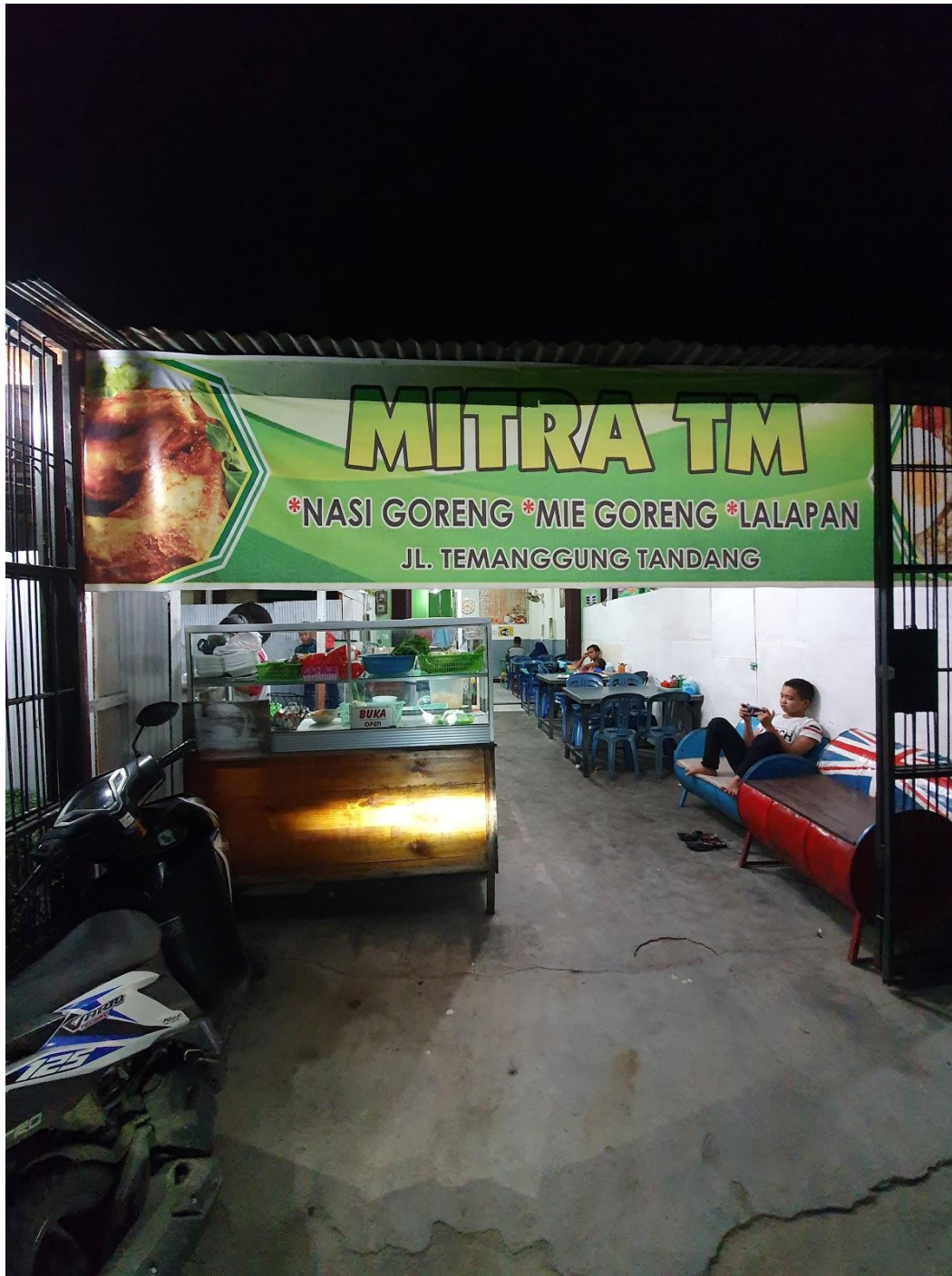
Gambar 8. 3 Nasi Goreng Mitra

"Soto Banjar Jali" mewakili kekayaan kuliner nusantara dengan penyajian soto Banjar yang lezat dan autentik, menarik perhatian para pencinta masakan tradisional. Pelanggan yang datang dari jauh mengakui bahwa perjalanan mereka terbayar dengan rasa soto yang sangat cocok di lidah, menegaskan kesulitan menemukan soto Banjar asli seperti di "Soto Banjar Jali". Selain soto, ayam