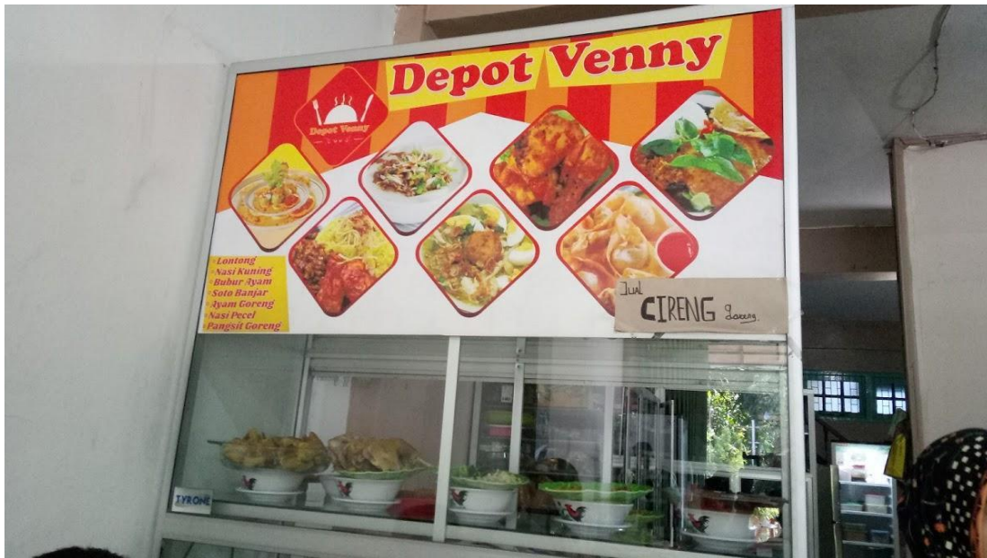
Gambar 8. 2 Depot Venny

jumlahnya, kualitas dan keanekaragaman menu, termasuk nasi kuning dan bubur yang disajikan tetap hangat hingga suapan terakhir, berhasil menarik minat pelanggan. Selain itu, Depot Venny juga menawarkan variasi cemilan seperti cakwe, pastel, dan roti, yang semuanya enak dan menjadi tambahan yang menyenangkan untuk menu utama. Dengan harga yang kompetitif dan opsi pembayaran yang fleksibel, baik tunai maupun non tunai, Depot Venny menjadi pilihan yang terjangkau untuk semua. Baik untuk sarapan bersama keluarga, teman, maupun rekan kerja, Depot Venny menyuguhkan pengalaman bersantap yang memuaskan dengan pilihan pecel terenak di Palangkaraya, nasi kuning yang unik, dan bubur ayam yang kaya rasa. Kebersihan yang dijaga dan keramahan pelayanan menambah nilai plus, membuat setiap kunjungan ke Depot Venny menjadi pengalaman kuliner yang tidak hanya enak tapi juga menyenangkan. keluarga.