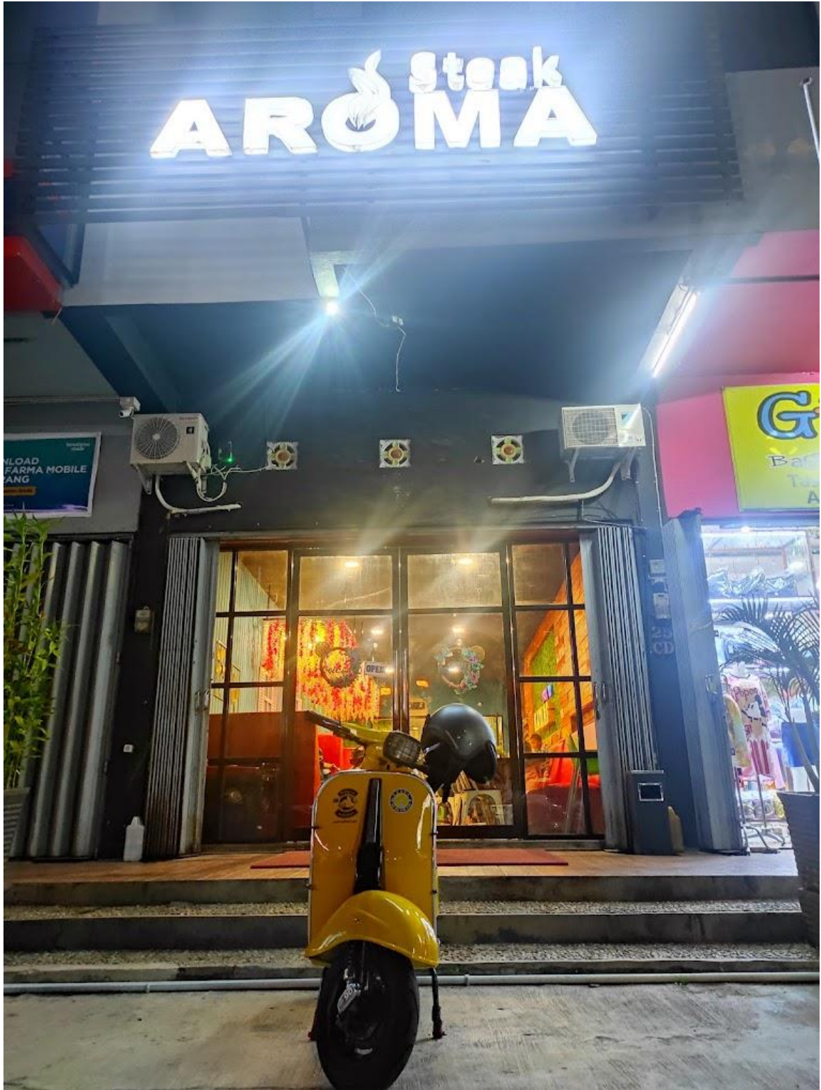
Gambar 8.1 Steak Aroma